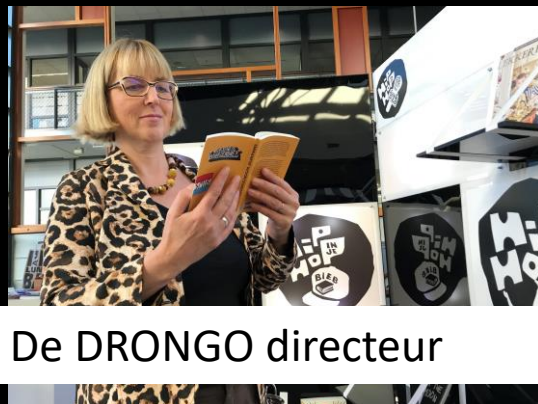
De DRONGO directeur