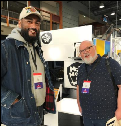
De hoogleraar orthopedagogiek