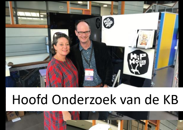
Hoofd Onderzoek van de KB