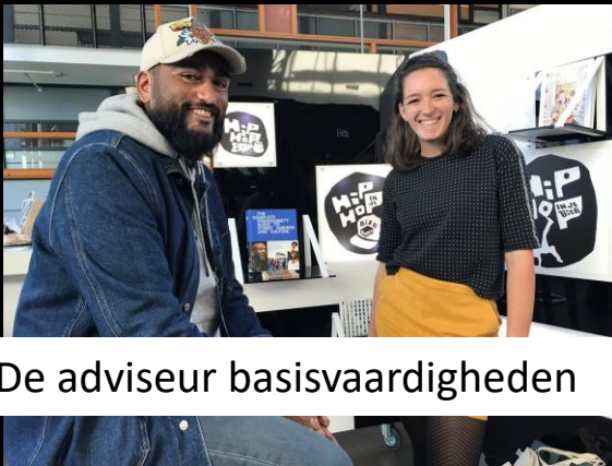
De adviseur basisvaardigheden

Hiphopinjebieb sprak met Jan en alleman op het DRONGO talenfestival en vond gehoor en weerklank van alle 100 mensen die met ons kwamen praten. Onze Taal eerde ons met de prijs voor het coolste / heetste lab van het festival.