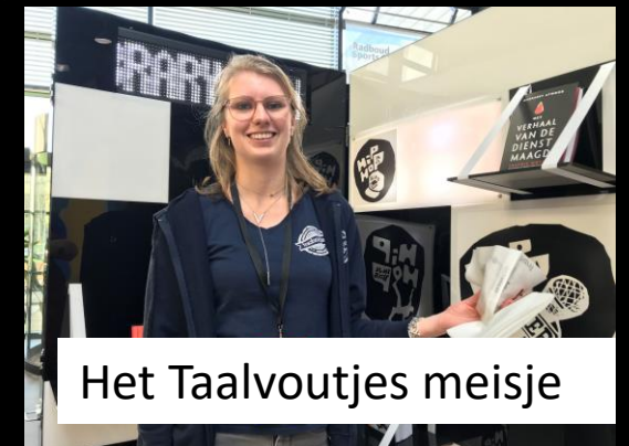
Het Taalvoutjes meisje